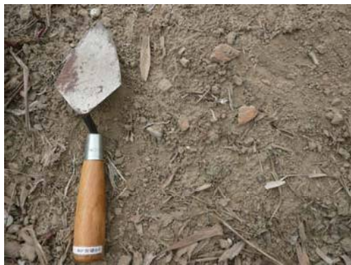
圖說：散佈於芒果園中細碎的夾砂陶片