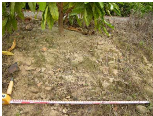
圖說：因開挖排水溝而翻攪出的夾砂陶片